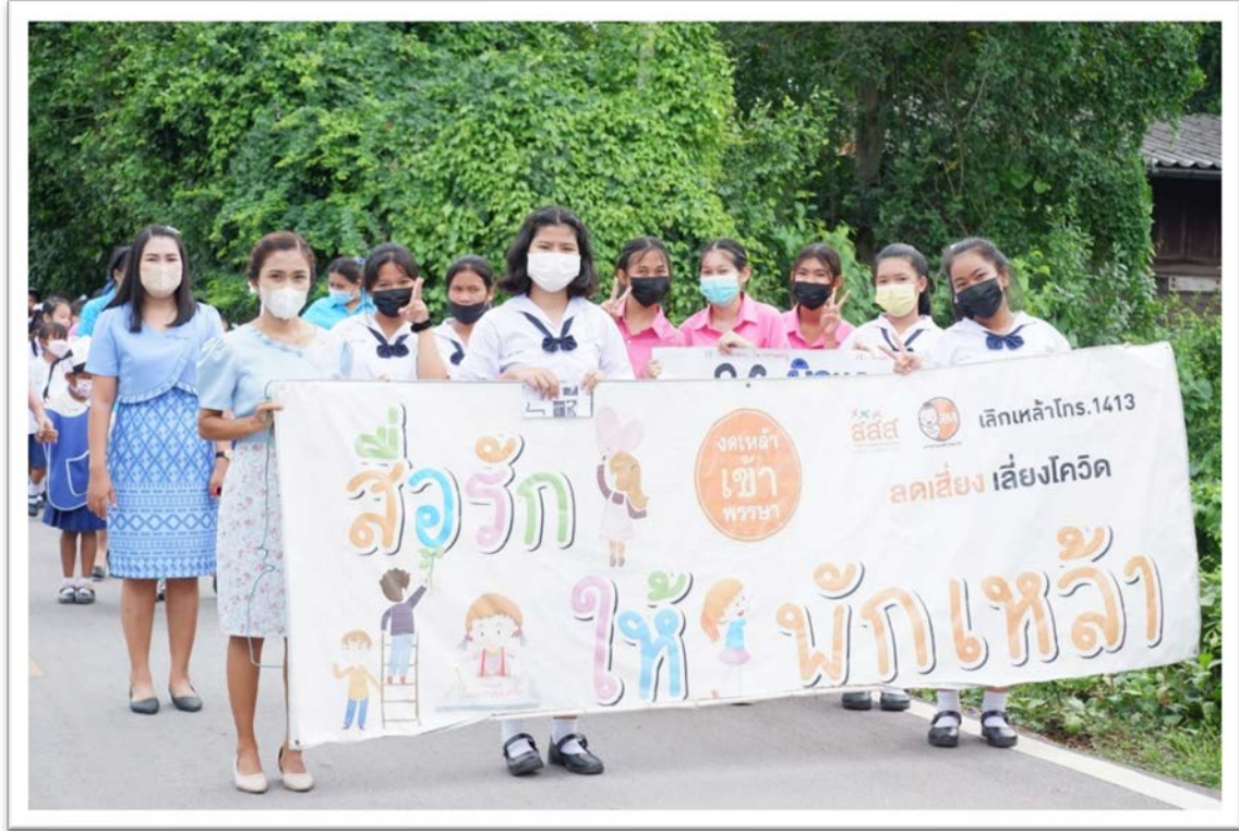
กิจกรรมเดินรณรงค์ต่อต้านยาเสพติด