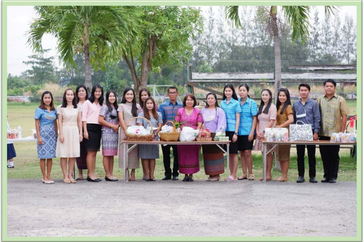
คณะครูโรงเรียนอนุบาลปากท่อร่วมทำบุญในกิจกรรมวันขึ้นปีใหม่